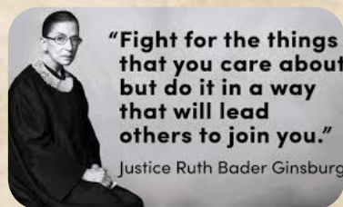
РУТ БЕЙДЪР ГИНСБУРГ