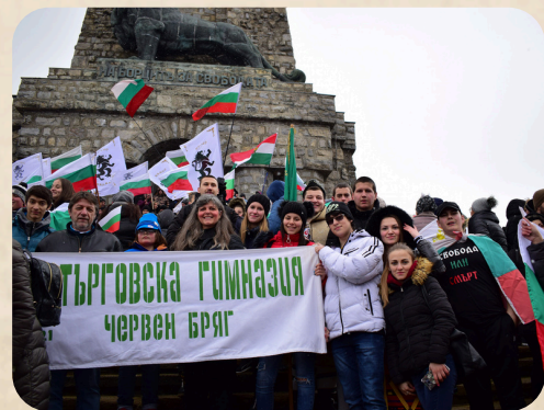
ТГ на Шипка 2019г.