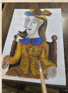
Рисунка на Иван Йорданов /10 А КЛАС/ “Дора Маар” (1939г.) ПАБЛО ПИКАСО