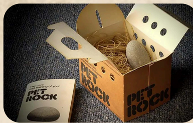
Идея за милиони!

Вашият домашен камък ще бъде предан приятел и спътник за години напред. Камъните имат доста дълъг живот, така че никога няма да се налага да се разделяте – поне не по вина на вашия домашен камък.