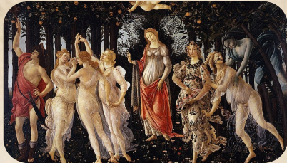
“Пролет” (1478) - Сандро Ботичели