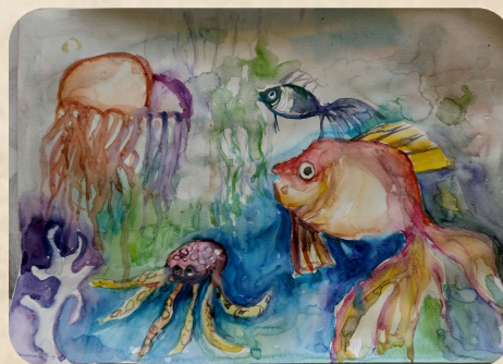
РИСУНКА - ИВАН ЙОРДАНОВ 10 А КЛАС ВТГ