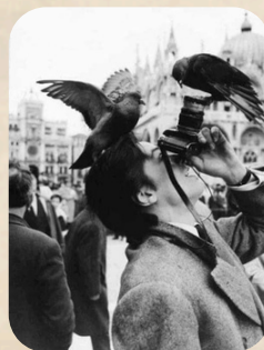
Ален Делон във Венеция

Бъдете смели, мечтайте и не спирайте да обичате света с широко отворени очи!