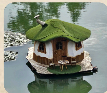
Плаващата къщичка в “Златен парк” - гр. Луковит