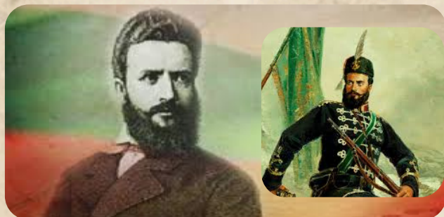
Поклон пред Христо Ботев и героите на България!

Да си спомним. Да се поклоним. Да продължим напред – достойни и свободни!